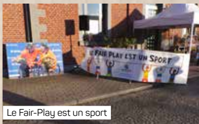
Le Fair-Play est un sport