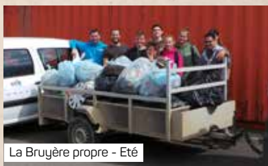
La Bruyère propre - Eté