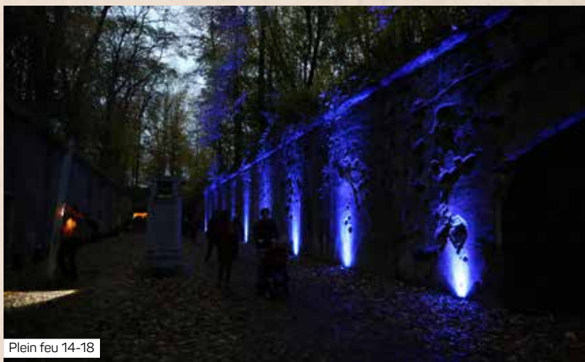
Plein feu 14-18