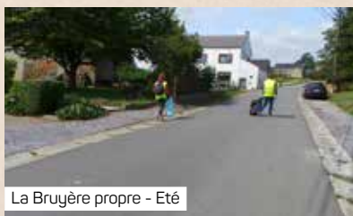
La Bruyère propre - Eté