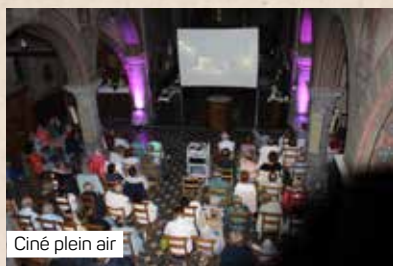
Ciné plein air