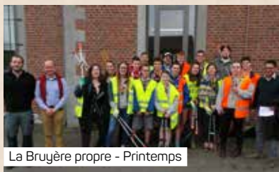
La Bruyère propre - Printemps