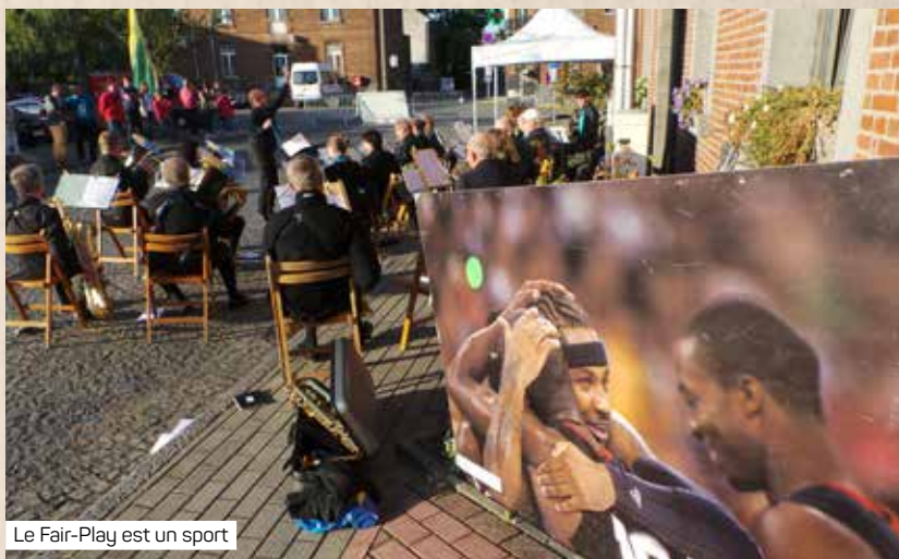
Le Fair-Play est un sport