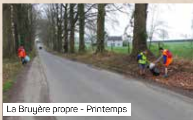
La Bruyère propre - Printemps