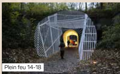
Plein feu 14-18