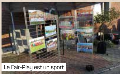
Le Fair-Play est un sport