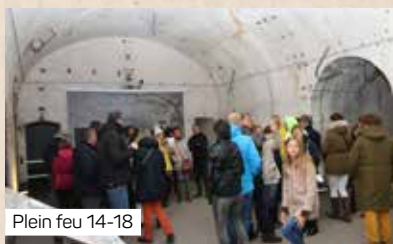
Plein feu 14-18