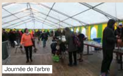
Journée de l'arbre