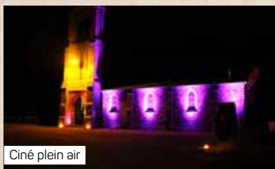
Ciné plein air