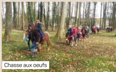
Chasse aux oeufs