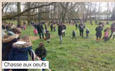
Chasse aux oeufs