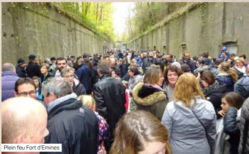
Plein feu Fort d'Emines