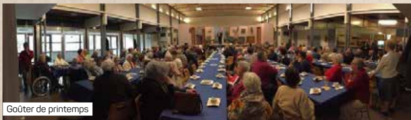
Goûter de printemps