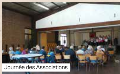
Journée des Associations