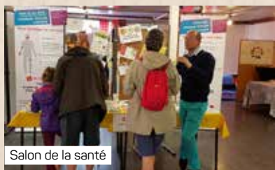
Salon de la santé