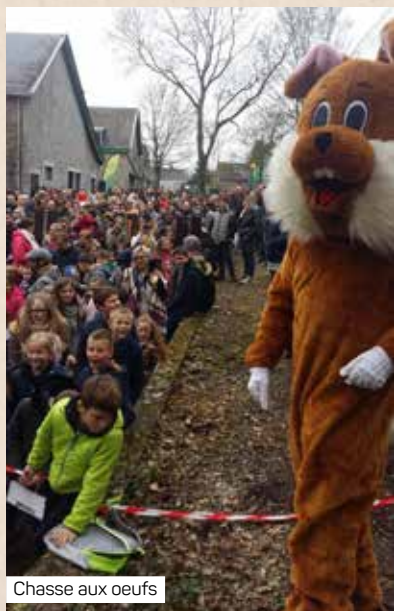
Chasse aux oeufs

N'hésitez pas à nous transmettre vos coordonnées pour être tenus informés ou rendez-nous visite sur notre page Facebook.