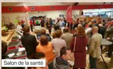
Salon de la santé