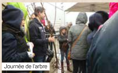
Journée de l'arbre