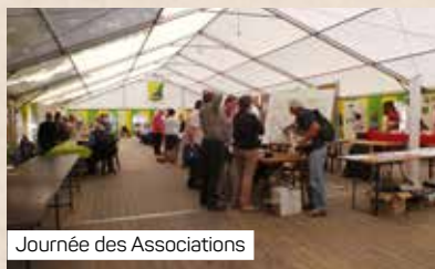
Journée des Associations